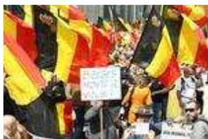
Belgier demonstrieren für die Einheit ihres Landes

Sie haben lange stillgehalten, zu lange vielleicht. Haben über Monate hinweg zugesehen, was die Politik aus ihrem Land gemacht hat. Jetzt wollen Belgiens 25 Topunternehmer nicht länger schweigen. Einen offenen Brief haben sie geschrieben. Dass es so nicht weitergehen kann.