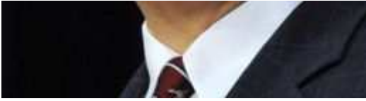
Tiefzinspolitik: Notenbank-Chef Ben Bernanke.